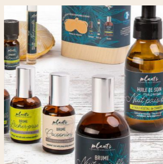
SOINS DU CORPS