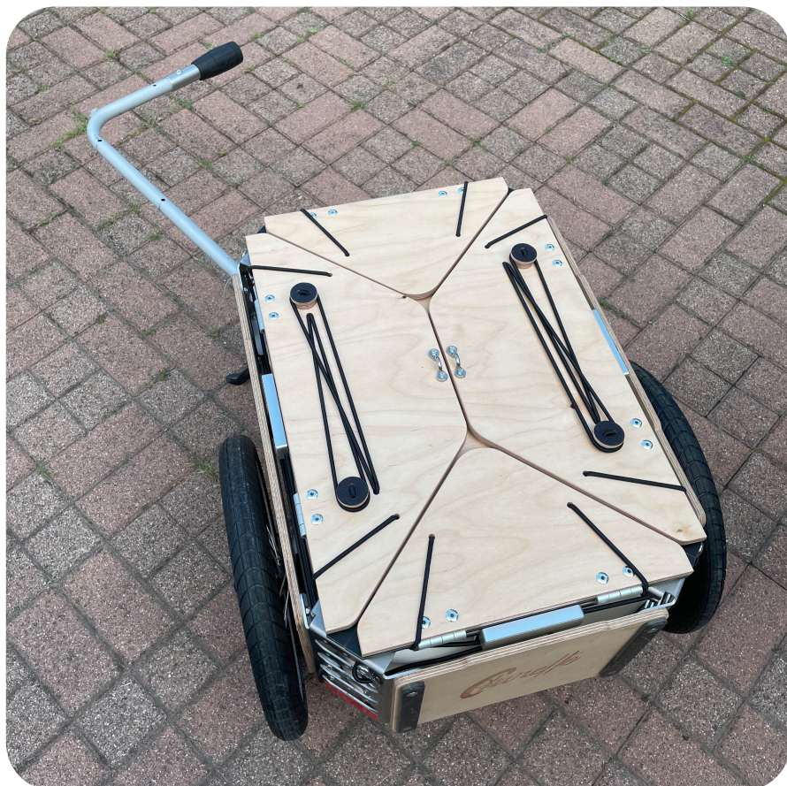
Ouvrez les élastiques