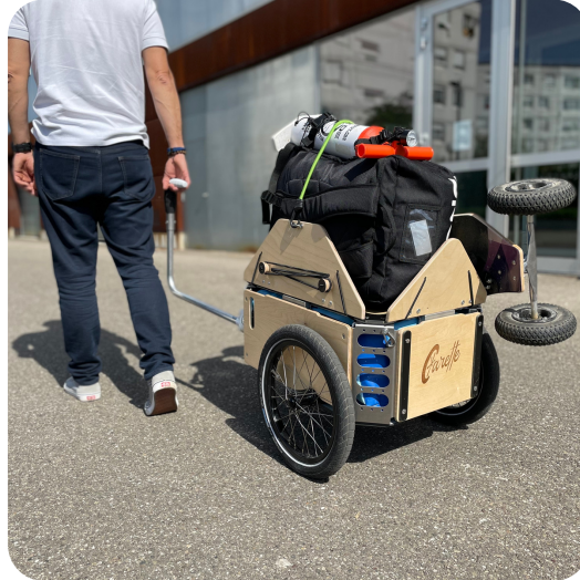
A la main