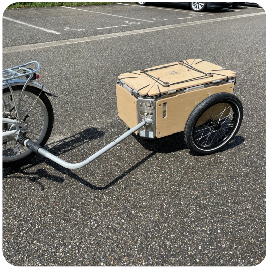
Connectée au cycle