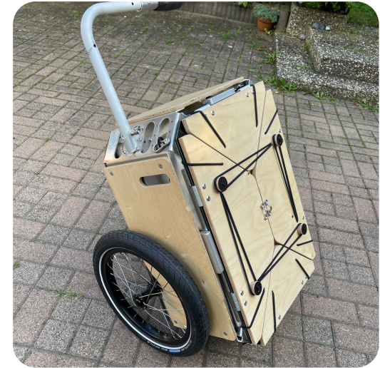
En mode valise