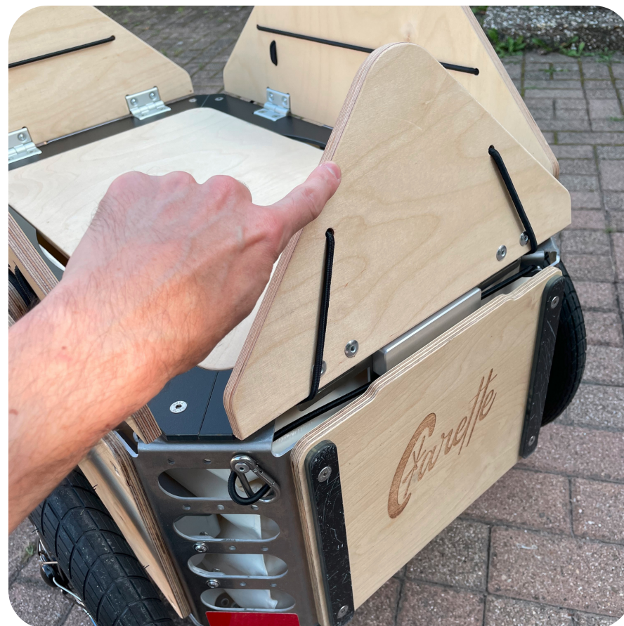
Ouvrez les 4 pétales en vertical