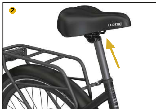
Set the saddle to the desired height