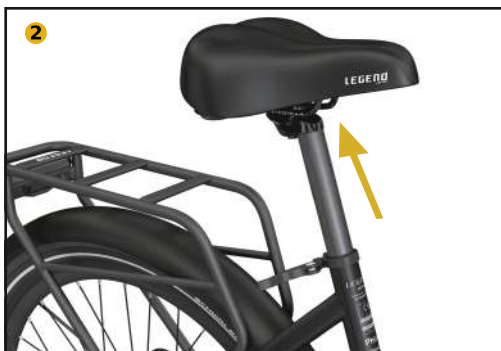
Ajuste la altura