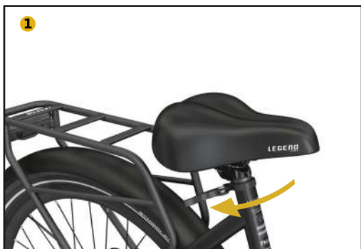
Desserrer la fixation rapide