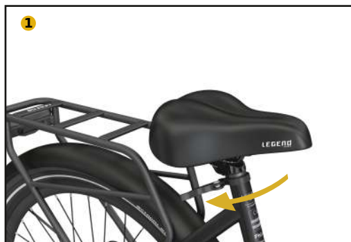
Loosen the quick release