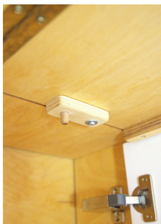
6. Positionnez le loquet de stabilisation