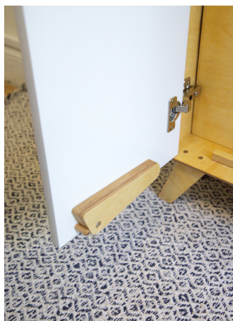
2. Dépliez les pieds de chaque côté