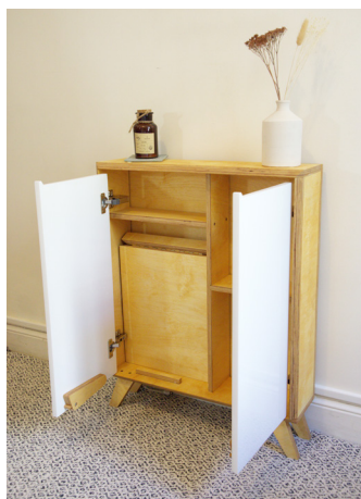
1. Ouvrez les portes