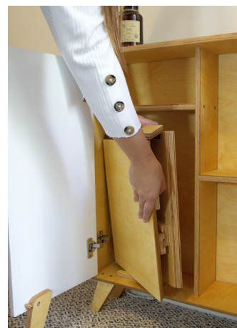
3. Sortez le plateau