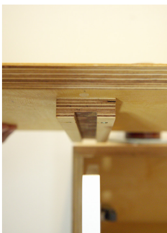
5. Positionnez les rainures sur les portes